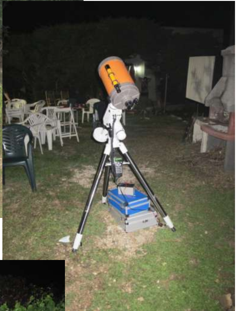
Vari tipi di telescopi Schmidt-Cassegrain