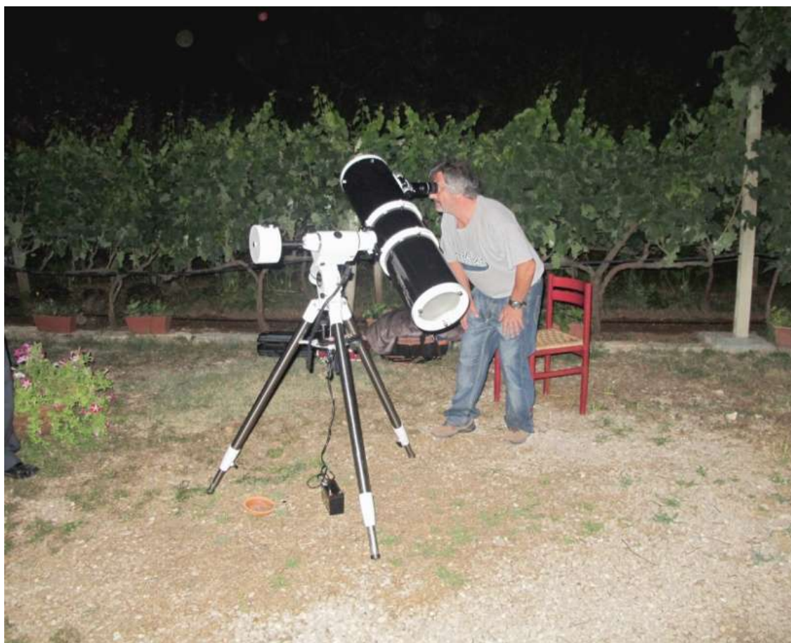
Telescopio riflettore Newton